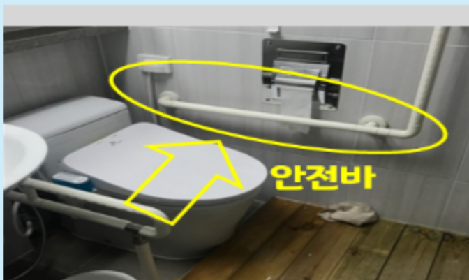
화장실 안전바 설치사례1