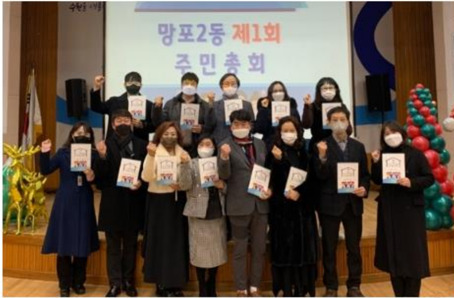
▲ 수원시 영통구 망포2동, 제1회 주민총회 및 작품전시회 개최

[케이에스피뉴스=김지태 문화전문기자 kspa@kspnews.com] 수원특례시 영통구 망포2동 주민자치회는 지난 15일 '망포2동 제1회 주민총회 및 작품전시회'를 개최했다.